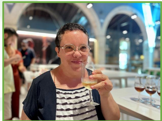
Visita a les "Bodegas Osborne"